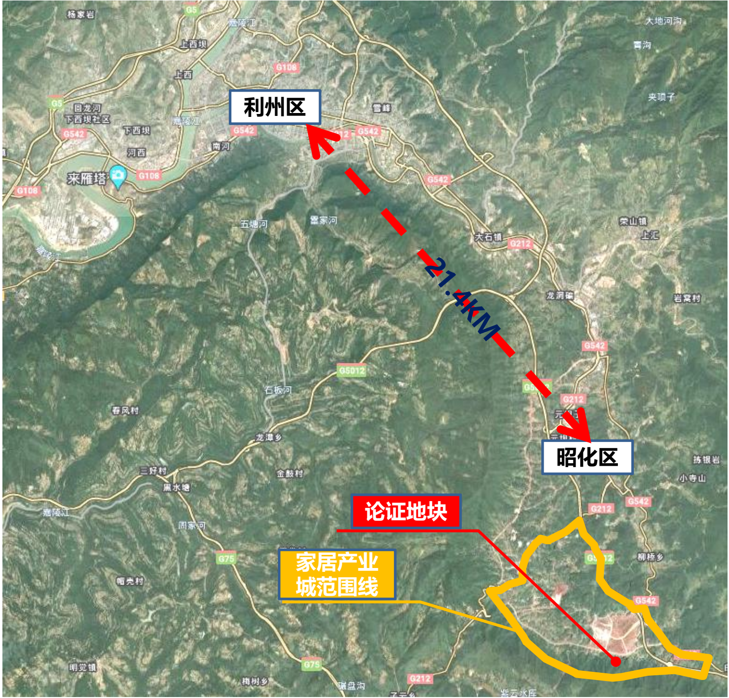
拟调整地块区位图