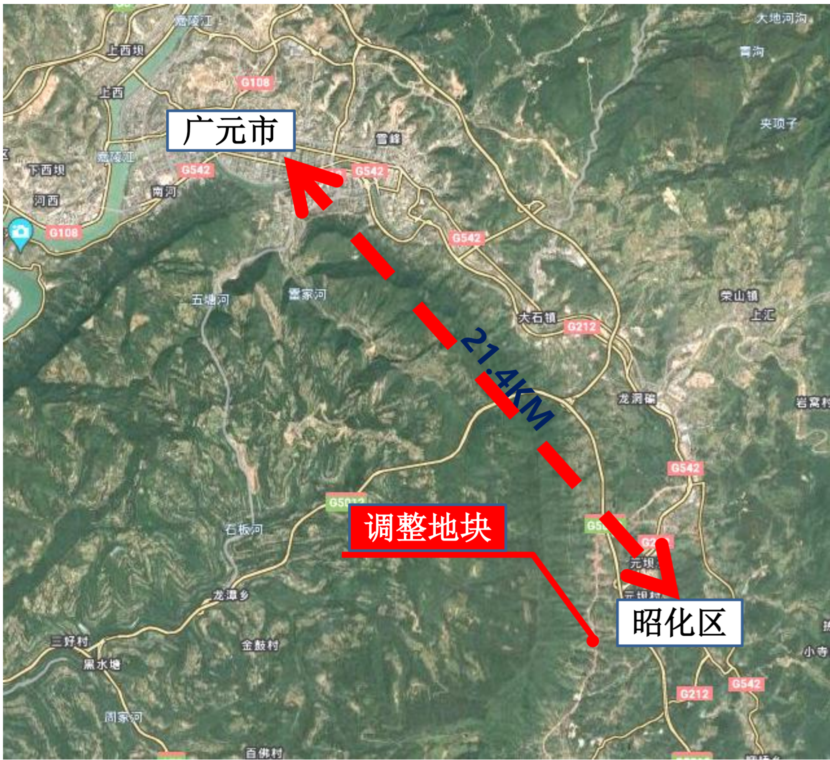
拟调整地块区位图